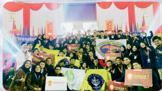
Terbaik 1 Abdidaya 2022