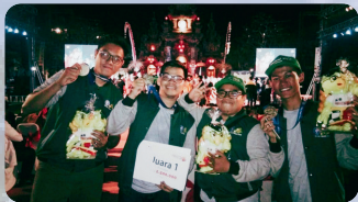
Medali Emas Pada PIMNAS 2019