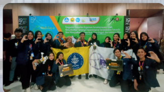
Terbaik 1 Abdidaya 2023