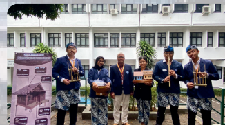
Medali Emas Pada PIMNAS 2023